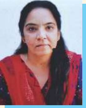
सीमा प्रबंधक(राजभाषा) क्षेत्रीय कार्यालय नई दिल्ली