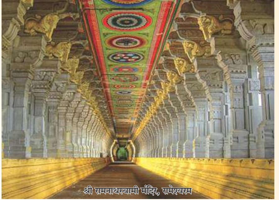
श्री रामनाथस्वामी मंदिर, रामेश्वरम

अलपुष्पा के बैकवाटर सबसे लोकप्रिय पर्यटन आकर्षण है। यहां छोटी नावों से लोग यात्रा करते हैं। अलपुष्पा का मुख्य आकर्षण है – हाऊसबोट। यह एक नाव होती है जो लकड़ी से बनी होती है, घर जैसी सारी सुविधाएं यहां उपलब्ध होती हैं। जैसे-टीवी, फ्रिज, ए सी, सोने के लिए बिस्तर आदि सब चीजें होती हैं। हाऊसबोट में किया गया सफर मेरे लिए सबसे यादगार रहा। रात को जब हाऊसबोट चलती है तो चंद्रमा के शीतल प्रकाश में समुंद्र का पानी चमकने लगता है। ऐसा लगता है कि मानो जीवन में इससे सुंदर क्षण और कोई हो ही नहीं सकता। हाऊसबोट में एक दिन बिताकर हम अगले दिन सुबह रामेश्वरम के लिए निकल पड़े।