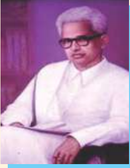
गोविंद शंकर कुरुप (03 जून 1901 – 2 फरवरी 1978)